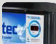
Control de Temperatura I-TEC

Con el objetivo de ofrecer las mejores opciones en equipamiento de refrigeración comercial, Criotec se ha preparado con una línea de equipamiento innovador con componentes de alta calidad y excelentes niveles de presentación , que constantemente ofreceran el más eficiente consumo de energía y servicio por muchos años.