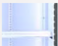
Sistema de iluminación LED