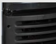
Compresor de última generación