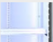
Sistema de iluminación LED