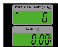
Pantallas de cuarzo con iluminación (backlight)