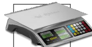
Incluye mica protectora