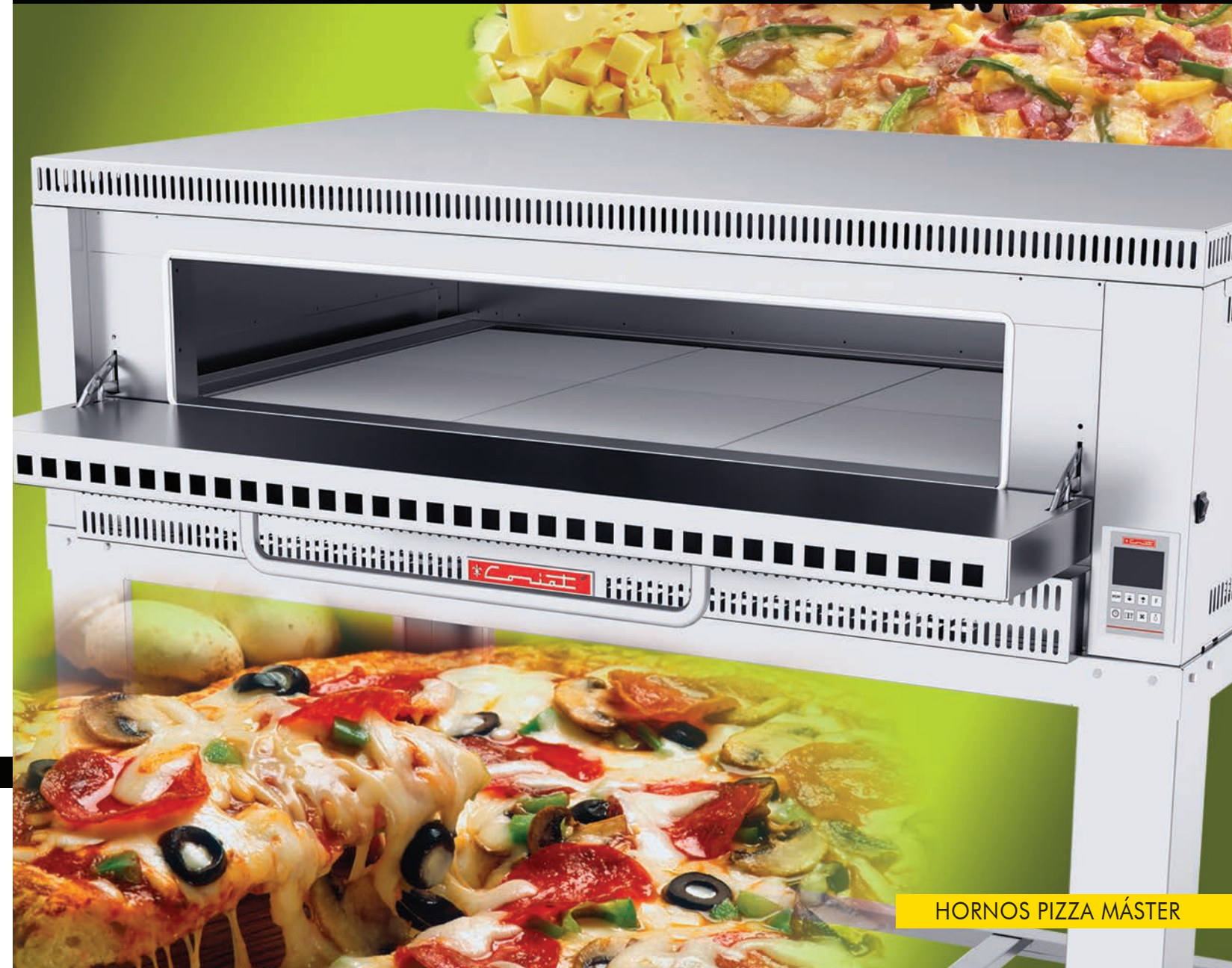
HORNOS PIZZA MÁSTER