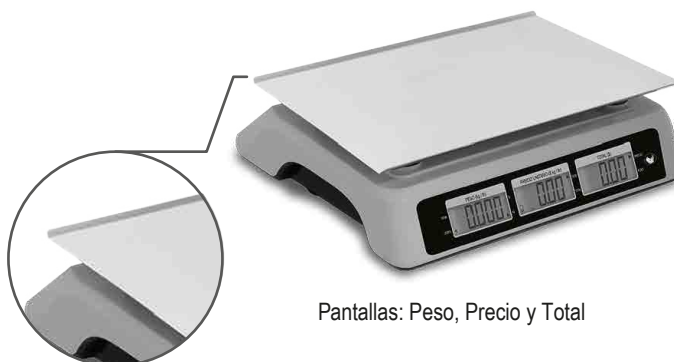
Pantallas: Peso, Precio y Total