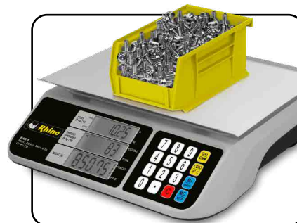
Función de conteo de piezas

SERVICIO Y REFACCIONES DISPONIBLES Contamos con una red de centros de servicio en toda la república: rhino.mx/servicio.html