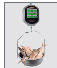
Ideal para verdulerías y recauderías