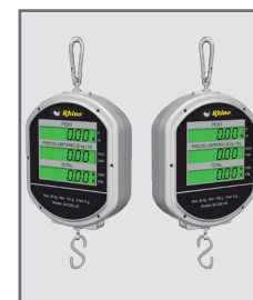
Pantallas para usuario y cliente con iluminación (backlight)