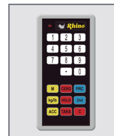
Incluye control remoto

SERVICIO Y REFACCIONES DISPONIBLES Contamos con una red de centros de servicio en toda la república: rhino.mx/servicio.html